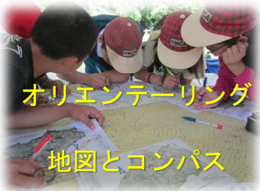
オリエンテーリング 地図とコンパス