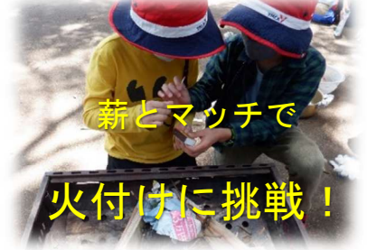
薪とマッチで 火付けに挑戦！